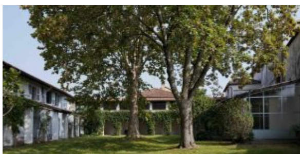
Casa Casorati a Pavarolo