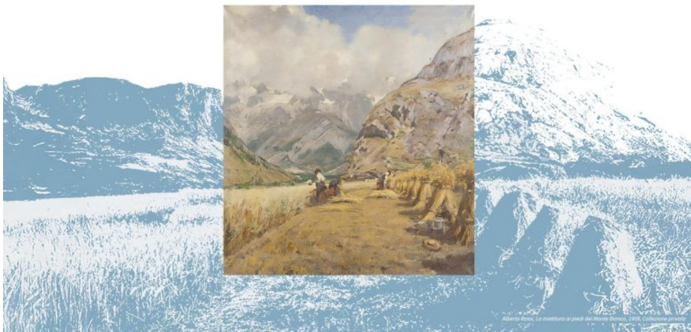
Alberto Ross, La mietitura ai piedi del Monte Bianco, 1905, Collezione privata

Rsvp | T. +39 0125 833811 | eventi@fortedibard.it