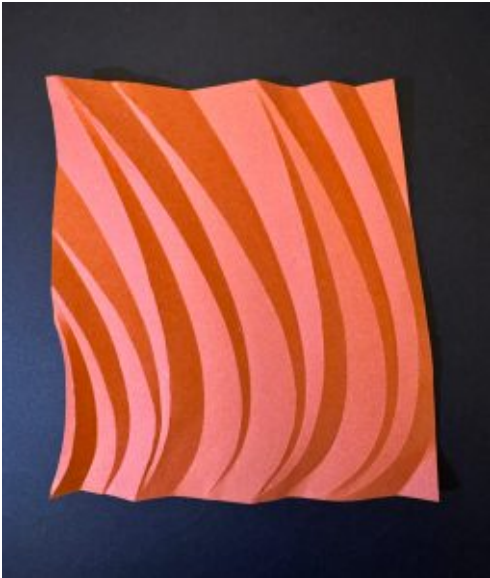
Giorgio Zocco 'Connections ' oragami carta

Venerdì 5 giugno 2026, alle ore 17,00 , nella Manica Lunga del Castello del Monferrato sarà inaugurata la mostra frutto del nuovo progetto promosso da Art Moletto "Connections" .