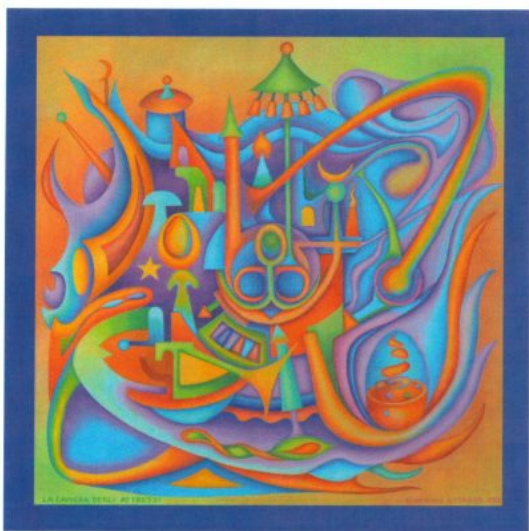
"La camera degli attrezzi", Aimasso - Sconfienza 2025